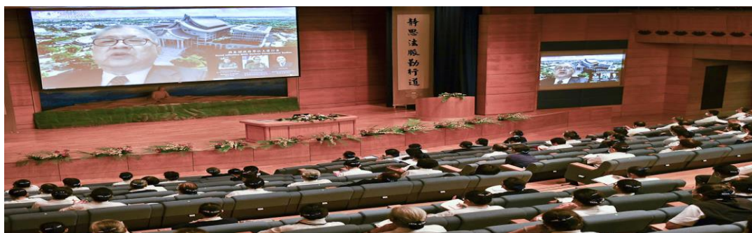
跨越種族和宗教 紅溪河畔大愛啟杏林 文/王孟加

2020年新型冠狀病毒肆虐全球，為了防止疫情擴散，許多國家實施封城政策，並頒布命令禁止集會，很多經濟活動、各國之間的交流也都因此取消或延期。原訂2020年11月啟用的印尼慈濟醫院，完工日期也延宕至2021年。雖然新冠病毒拖慢了原訂的施工進度，但印尼慈濟志工的腳步並沒有因此停歇。從疫情爆發開始，印尼慈濟志工募集各界愛心，採購防疫用品捐給醫療機構、政府單位。在相關部門的大力支持下，和政府合作發放防疫物資，足跡遍布印尼各省。