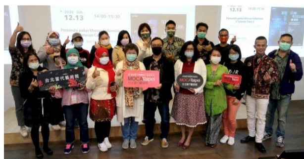
圖為台北當代藝術館特展印尼語導覽活動。

此外，台灣的表演藝術，以及跟台灣有關的文化活動，比方「台灣精品愛心公益路跑」經常在印尼舉行，而印尼也在台灣舉辦許多文化展覽。舉例而言，2018年，新北市政府和駐台北印尼經濟貿易代表處共同舉辦「印尼文化嘉年華(Nusantara Cultural Festival)」；2019年，台灣博物館舉辦印尼的「蠟染藝術節(Batik and Jumputan Festival)」；2020年台北當代藝術館的雙特展，由央廣主持人譚雲福進行印尼語導覽，帶領新住民及移工朋友深入了解展出內容。一位印尼新住民開心地說，她來台30年了，這是第一次遇到母語導覽活動，真的很感動。