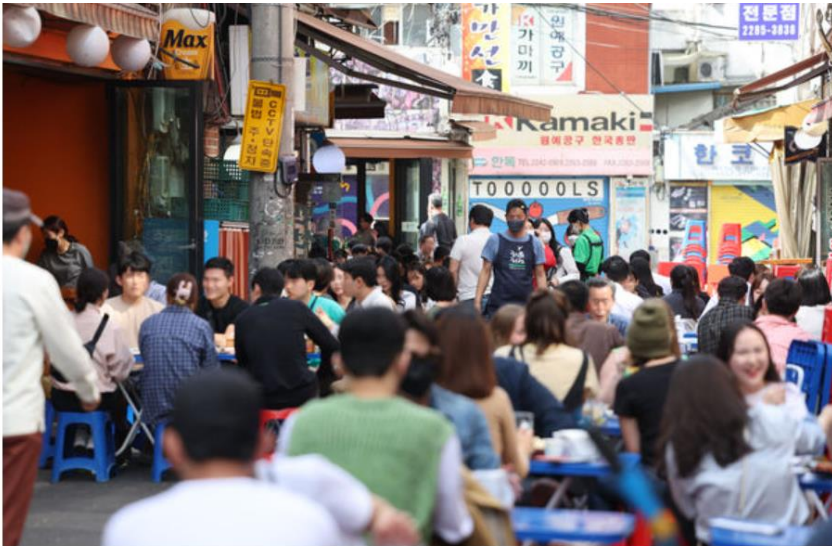
▲南韓政府29日宣布，5月2日起解除戶外口罩令。