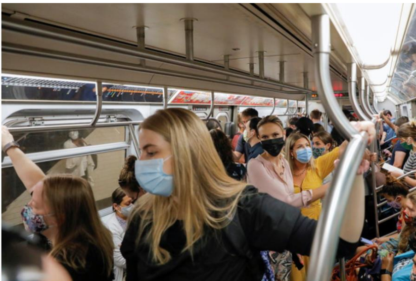
▲美國CDC在4月中宣布「大眾運輸口罩令」再延長至5月3日。

巴西衛生部長奎洛加 4 月 22 日簽署結束 COVID-19 大流行引起攸關國家利益的突發公共衛生事件法令，將在 30 天過渡期後於 5 月 22 日正式生效。這項法令的影響將是改變限制個人自由的預防措施等。