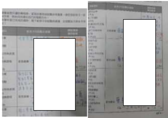
說明：家長的話-親師溝通