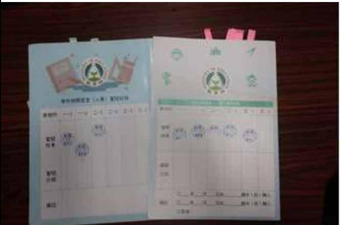
說明：檢查生涯手冊。