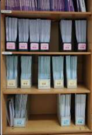
說明：國中生涯手冊依班級放置於資料盒中，平時保存於輔導室。