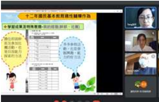
說明：線上親師日，國中生涯手冊宣導。