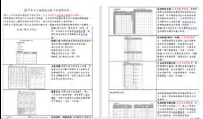
說明：國中生涯手冊填寫檢查說明