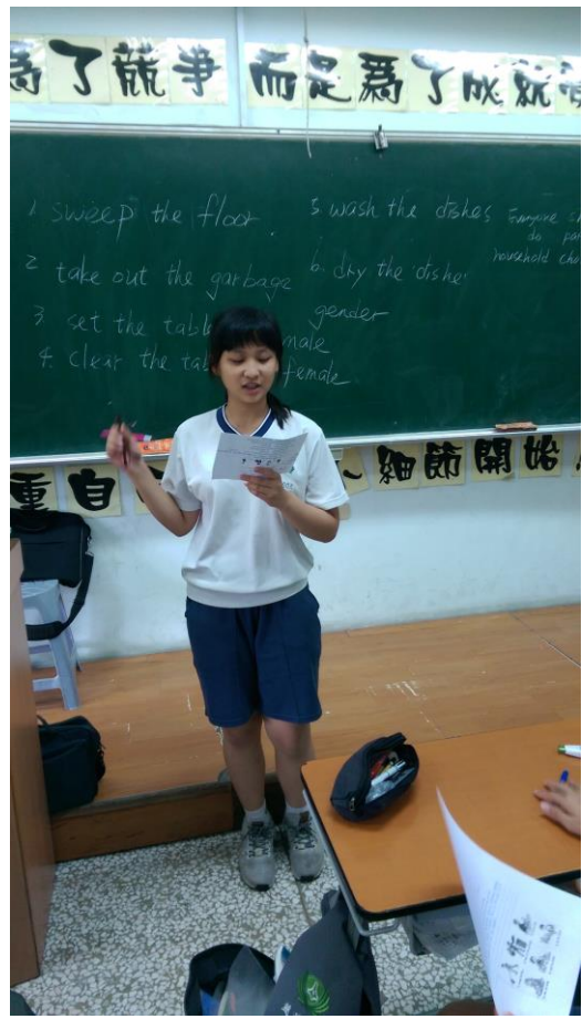
學生上臺發表學習單內容