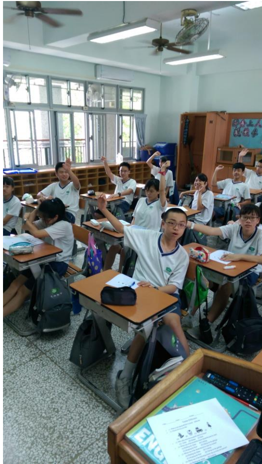
學生針對性平問題舉手回答問題