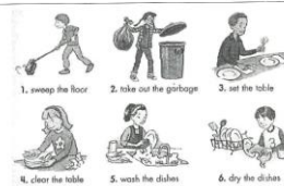
學生用心完成學習單

7. In your opinion, who should do the household chores at home, and why? I think everyone should do the household chores at home because everyone is a member of a family. A member should do the work in a group. So, everyone should do the household.