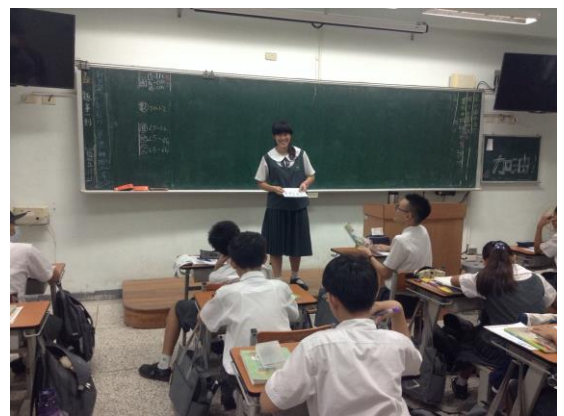
學生上台分享家中家事分工情形。