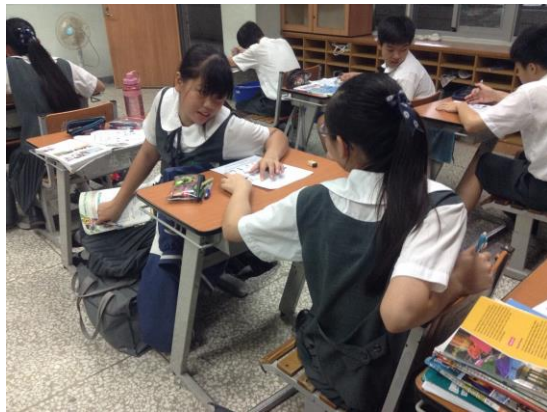
學生互相討論學習單上的內容。