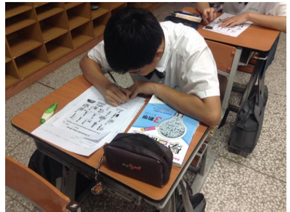
學生聽完老師引導後，回答學習單上面的問題。