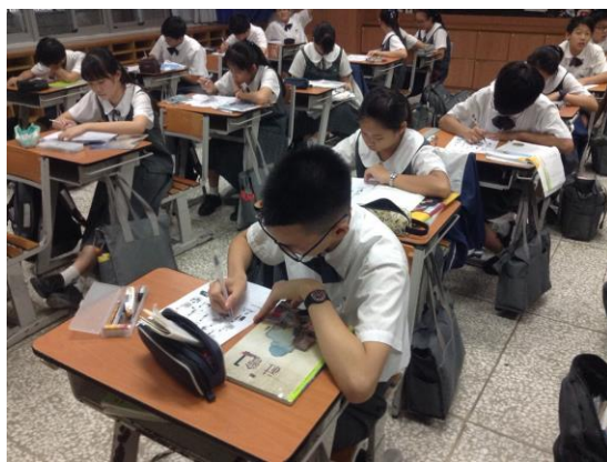
學生聽完老師引導後，回答學習單上面的問題。