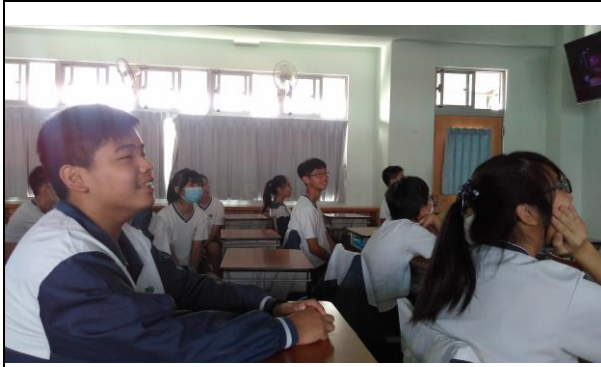
融入教學上課氣氛投入愉快的情形