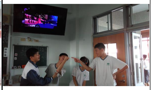
上台配音表演的學生無不使出渾身解數