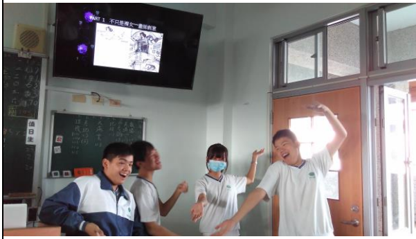
令全班捧腹大笑的上台配音表演