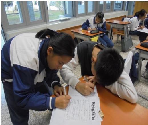
學生們兩兩一組，很用心的填寫學習單(一)。