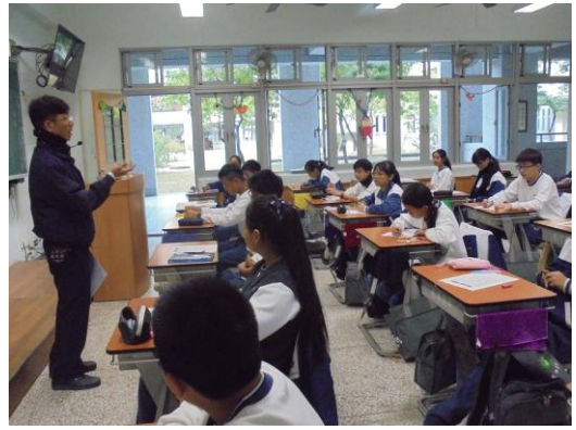
學生們都很專注的聆聽本次的主題