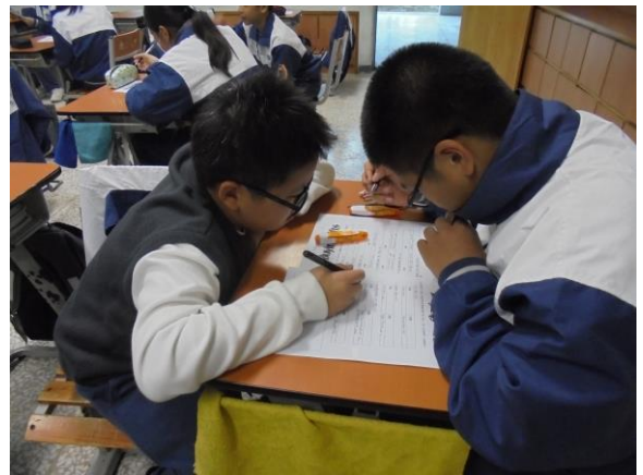
學生們兩兩一組很用心的填寫學習單(二)。