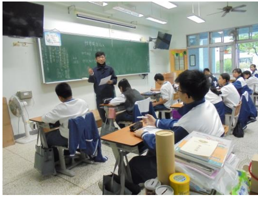
老師藉由第七課的課文介紹今日活動的主題