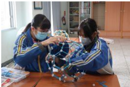
透過Zometool組件的組裝，培養、訓練學生的空間概念。