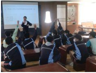
國文科透過遊戲競賽，提升參賽者的語文素養及國學常識。