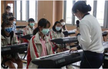
透過探索鍵盤基礎彈奏，期望讓學生享受藝術及科技之美。