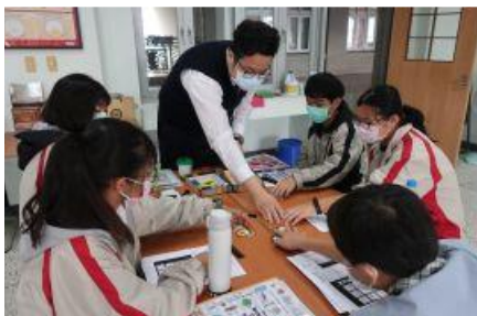
藝能科運用桌遊、牌卡讓學生探索自己的人格特質。