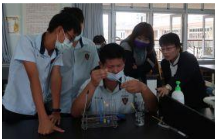
「液體疊羅漢」實驗時，老師提醒學生要細心地操作，才能堆疊出漂亮的顏色。